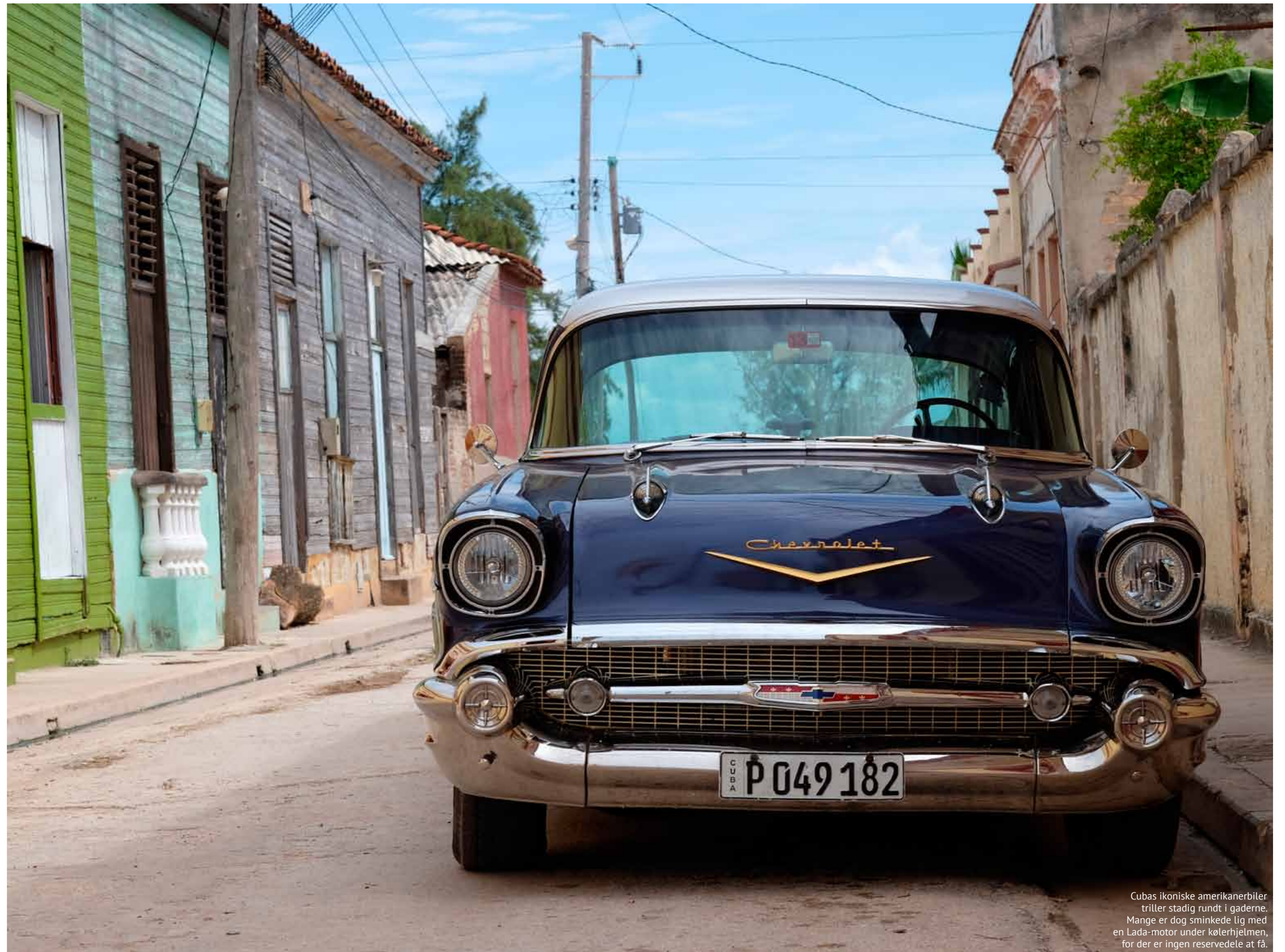
Cubas ikoniske amerikanerbiler triller stadig rundt i gaderne. Mange er dog sminkede lig med en Lada-motor under kølerhjelm, for der er ingen reservedele at få.

I Havana Vieja, den gamle bydel, kunne man fra halvt åbne døre ind til folks stuer høre voice-overen på de dokumentarfilm, som blev transmitteret på de statslige tv-kanaler i et endeløst loop. Som var