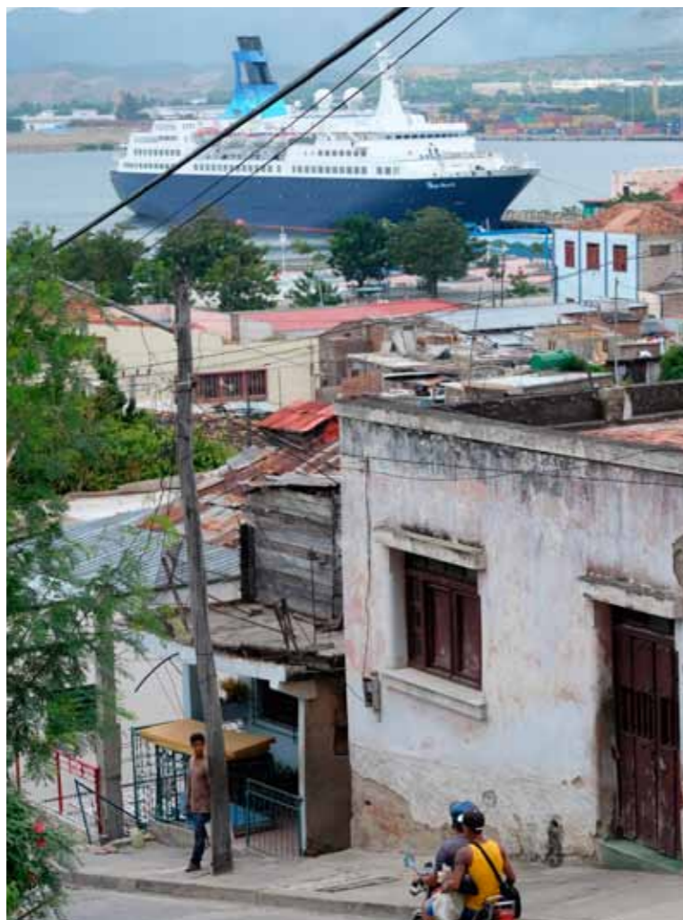
Krydstogtskib på vej ind i havnen i Santiago. Castro ligger i dag begravet på byens kirkegård.

"Hvornår kommer I?" vil en cykelrickshaw gerne vide. ●