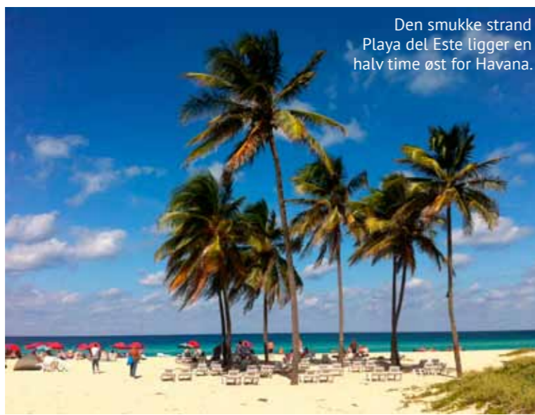
Den smukke strand Playa del Este ligger en halv time øst for Havana.