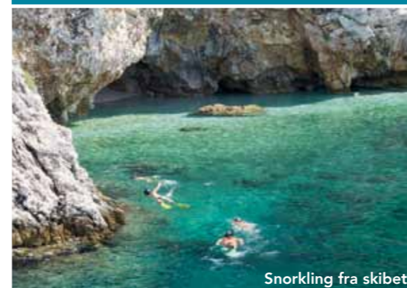
Snorkling fra skibet